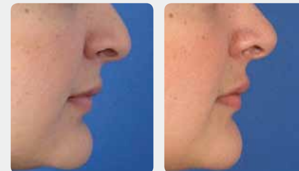
Ridefinizione naso e mento